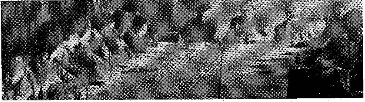
Karayollarında çalışan teknik elemanların ve TMMOB Yöneticilerinin Genel Müdürle yaptığı toplantı.

sözleşmeli sendikalaşma mücadelesinde ileri adımlar, attılar.