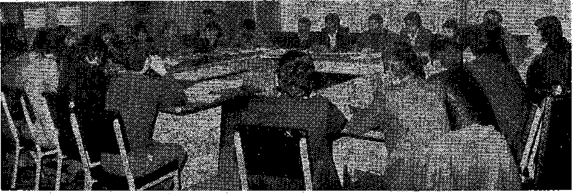
Ortak yönetim kurulları toplantısı.