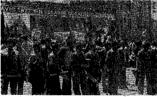
1 MAYIS işçi sınıfıyla omuz omuz.

lar Odası temsilcilerinden oluşan 5 kişilik bir hazırlık komitesi kuruldu. Bu dönemde DISK bütün hazırlık çalışmalarına demokratik örgütlerin tümünü çağırıdı. Bütün demokratik kuruluşlar ve T.M.M.O.B., 1 Mayıs hazırlık çalışmalarına katılarak çeşitli öneriler getirdiler. Böylece 1 Mayıs 1978'e yönelecek her türlü tertip ve saldırıyı boşa çıkaracak, disiplinli ve en sağlıklı bir günün kutlanması için çaba gösterdiler. Afişleme çalışmaları DISK ve Demokratik Kuruluşların ortak çabasıyla ülke çapında yaygınlaştı. T.M.M.O.B. ye bağlı odalar ve odamız üyeleri İstanbul'da ve Ankara'da afişleme kampanyasına aktif olarak katıldılar.